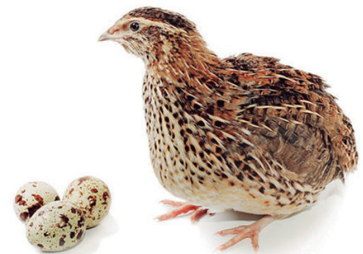
Figura 3: Relação do tamanho dos ovos de codorna com o tamanho da codorna.