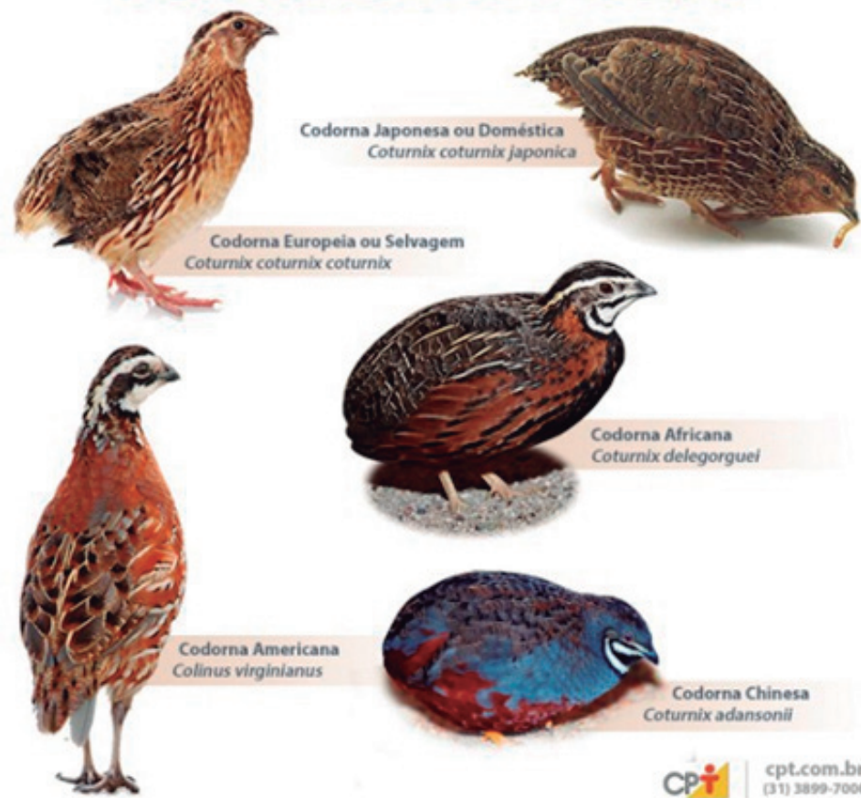
Figura 1: Espécies de codornas