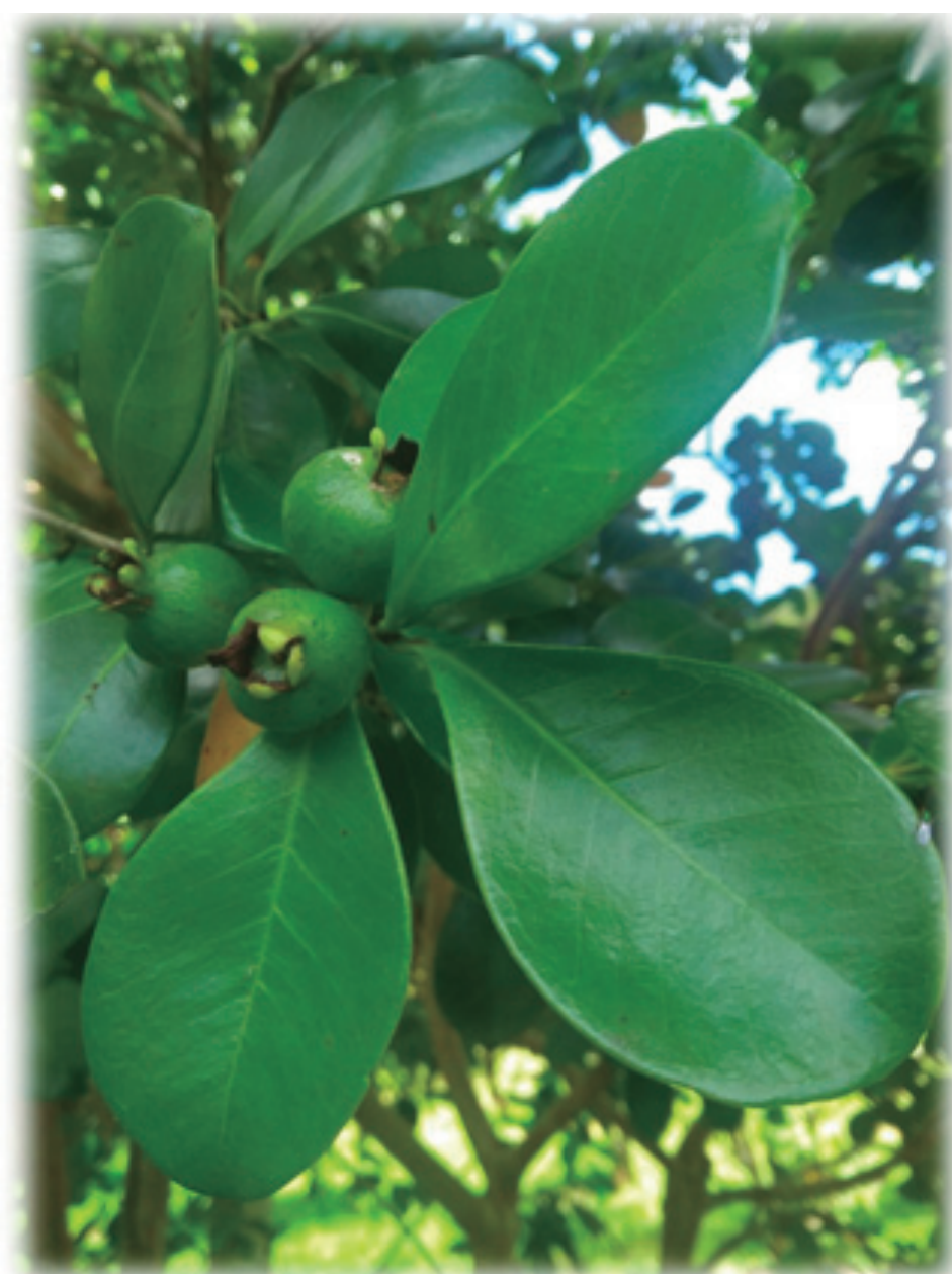
Folha e fruto verde de araçazeiro (araçá amarelo).

Portanto, a utilização de plantas com compostos bioativos como o araçazeiro, na forma de aditivo na alimentação de aves, podem ser uma alternativa natural e econômica para melhorar a produtividade e a saúde das poedeiras com a vantagem adicional de melhorarem a qualidade dos ovos.