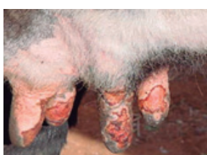
Úlceras nas tetas de vacas e nas mãos de ordenhadores causados pela varíola bovina