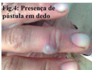
Fig.4: Presença de pústula em dedo

grandes potências econômicas. Nossa mensagem aqui é de que as epidemias sempre existiram, e sempre provocarão mortes, desde que não existam as vacinas específicas para cada doença. Contudo, morrem anualmente milhares de pessoas por causa de doenças virais, mesmo existindo as vacinas, como exemplo a Gripe A, a febre amarela, o sarampo, entre tantas outras, contudo, boa parte das vítimas, negligenciaram a prevenção. E, diante dos inúmeros casos de dengue na região, e ausência de uma vacina para a promoção dessa doença, a melhor forma de prevenir.