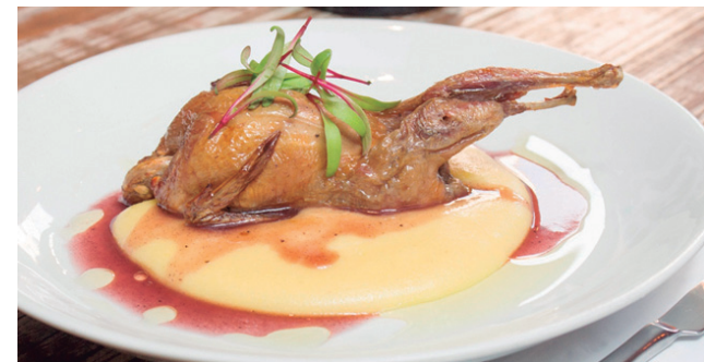
Figura 2: Codorna assada com molho de vinho tinto e polenta cremosa

O ovo é uma fonte de proteína animal de alto valor biológico. O peso do ovo de codorna varia de 9 a 13 gramas e é de considerável importância para avaliação da qualidade do mesmo. O ovo de codorna é um alimento completo e equilibrado em nutrientes, de baixo valor econômico, sendo uma fonte confiável de proteínas, lipídeos, aminoácidos essenciais, vitaminas e minerais. Contudo, a perda de qualidade do ovo é um fenômeno inevitável que acontece de forma contínua ao longo do tempo e que pode ser agravado por diversos fatores, dentre eles se destacam as condições de temperatura e umidade durante a esto-