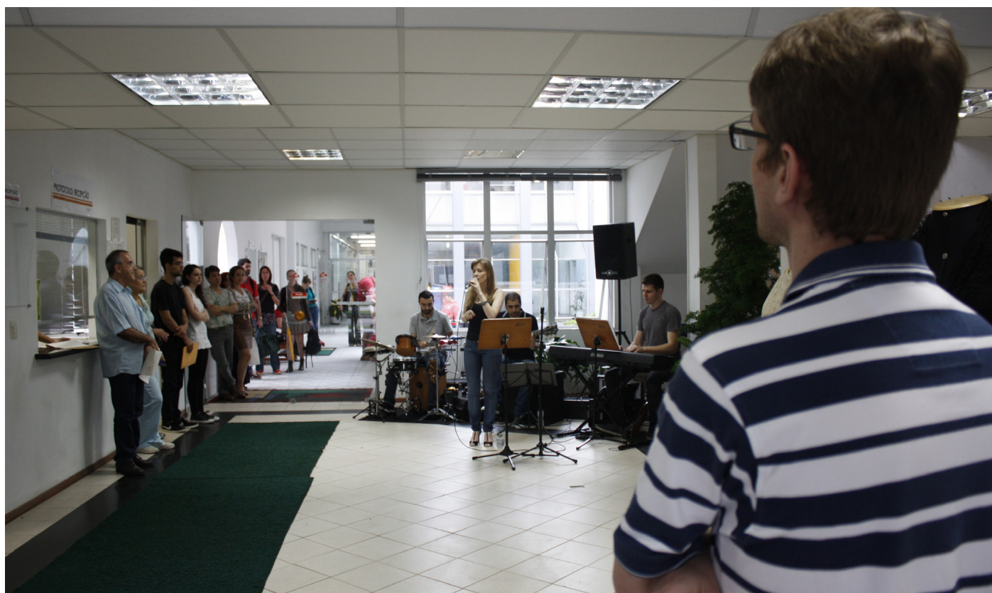
Comemoração pelo dia do professor