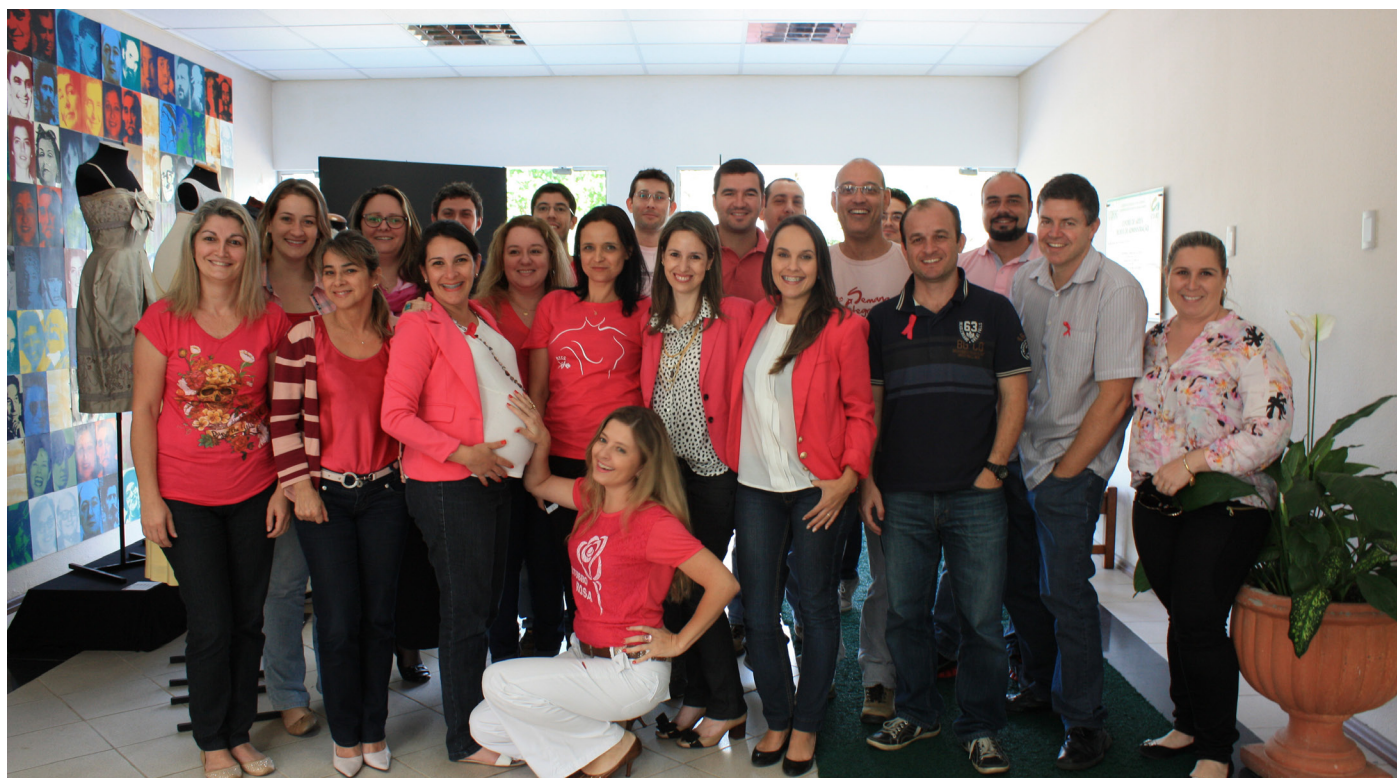
Dia Rosa, em alusão ao Outubro Rosa