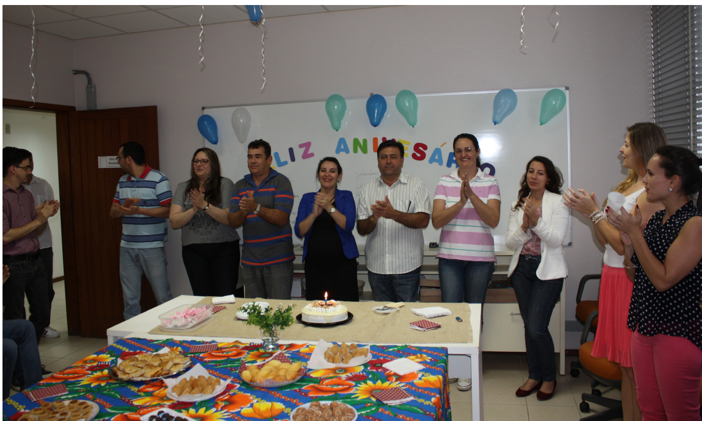
Comemoração dos aniversários de julho, agosto e setembro