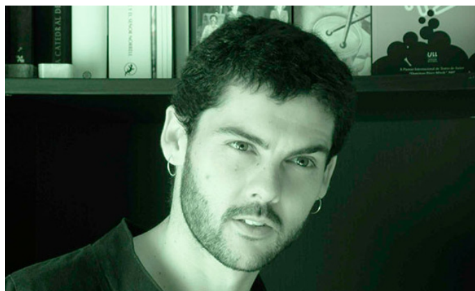
Oficina de Construção de Textos Teatrais.