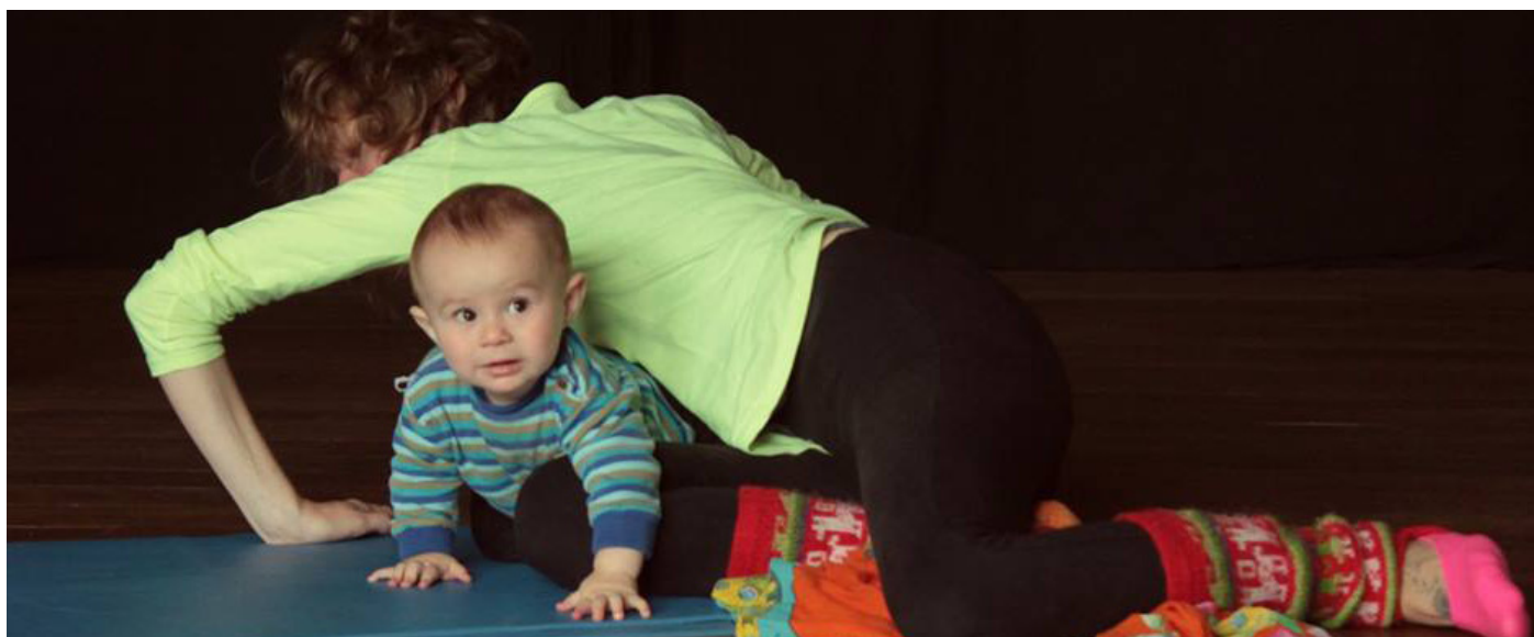
Oficinas do Programa Moinho.