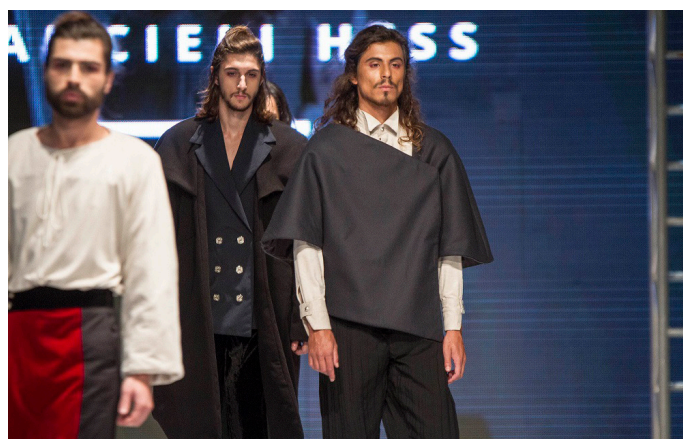
OCTA Fashion.