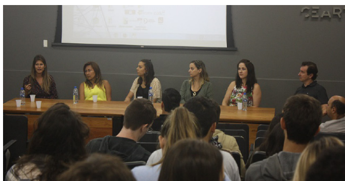
Mesa redonda com egressos de Design Gráfico e Industrial.