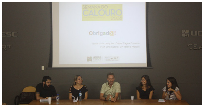
Bate-papo sobre bolsas acadêmicas com diretor de Extensão e bolsistas.