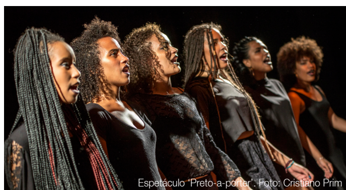
Espectáculo 'Preto-a-porter'.