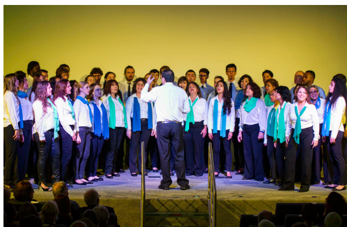
Coral da Udesc. Fotos: Cristiano Prim