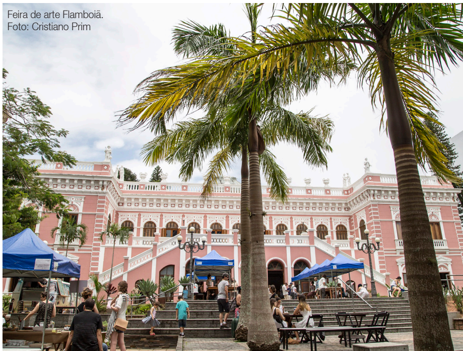
Feira de arte Flamboiã.