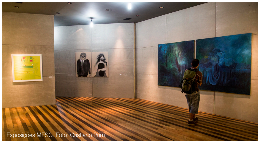
Exposições MESC.