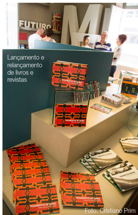
Lançamento e relançamento de livros e revistas