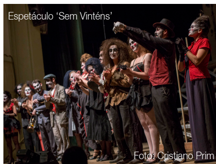
Espectáculo 'Sem Vinténs'