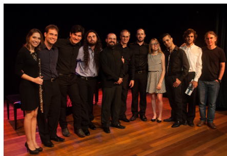
Recital Musicâmara.