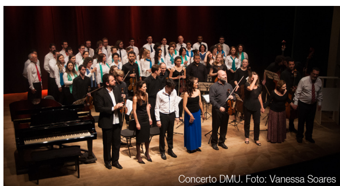
Concerto DMU.