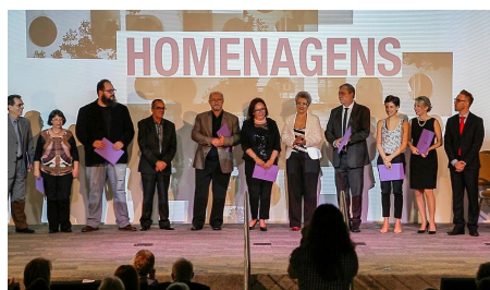
À esquerda, homenageados na Cerimônia de 30 anos do Ceart