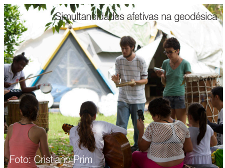
Simultaneidade das afetivas na geodésica