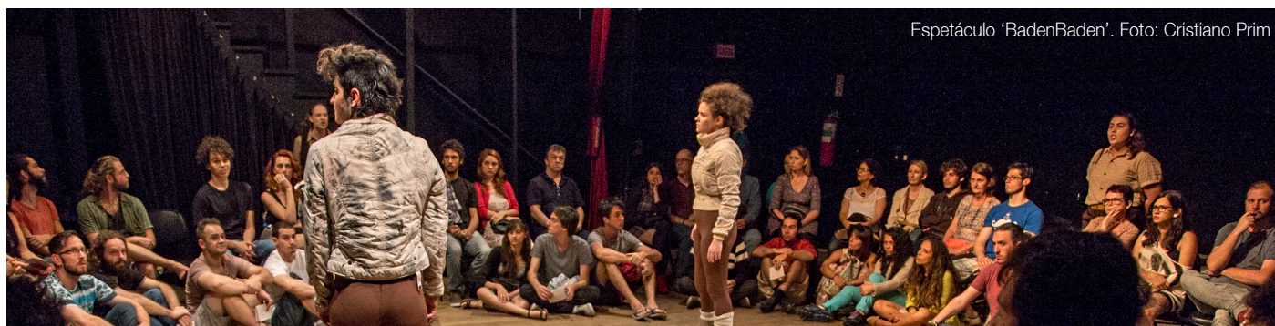
Espectáculo 'BadenBaden'.