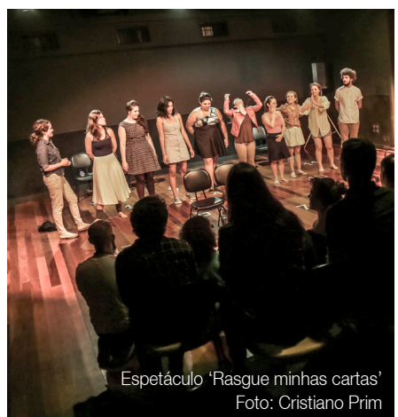
Espectáculo 'Rasgue minhas cartas'