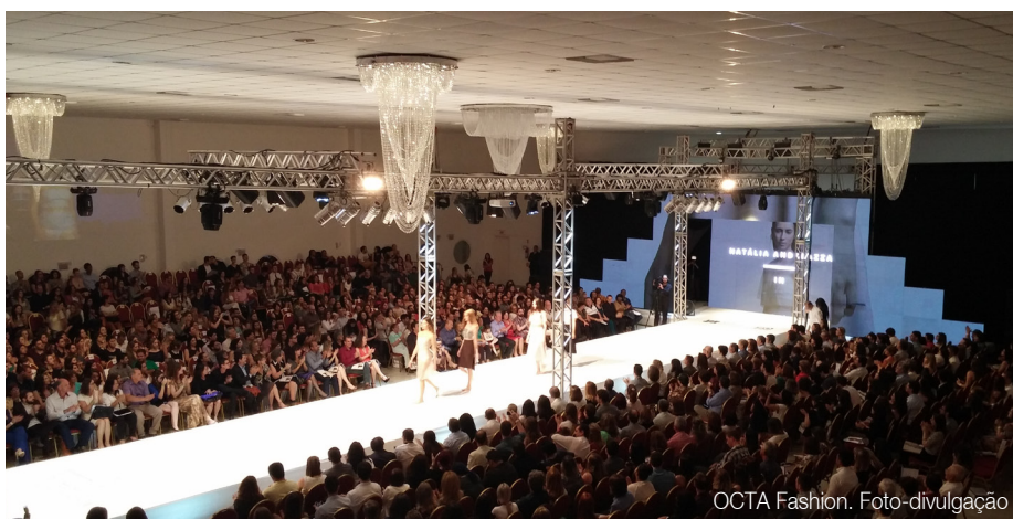
OCTA Fashion. Foto-divulgação