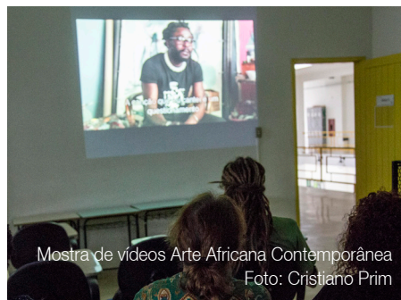
Mostra de vídeos Arte Africana Contemporânea