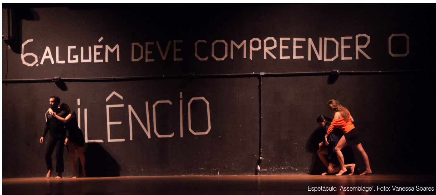
Espectáculo 'Assemblage'.